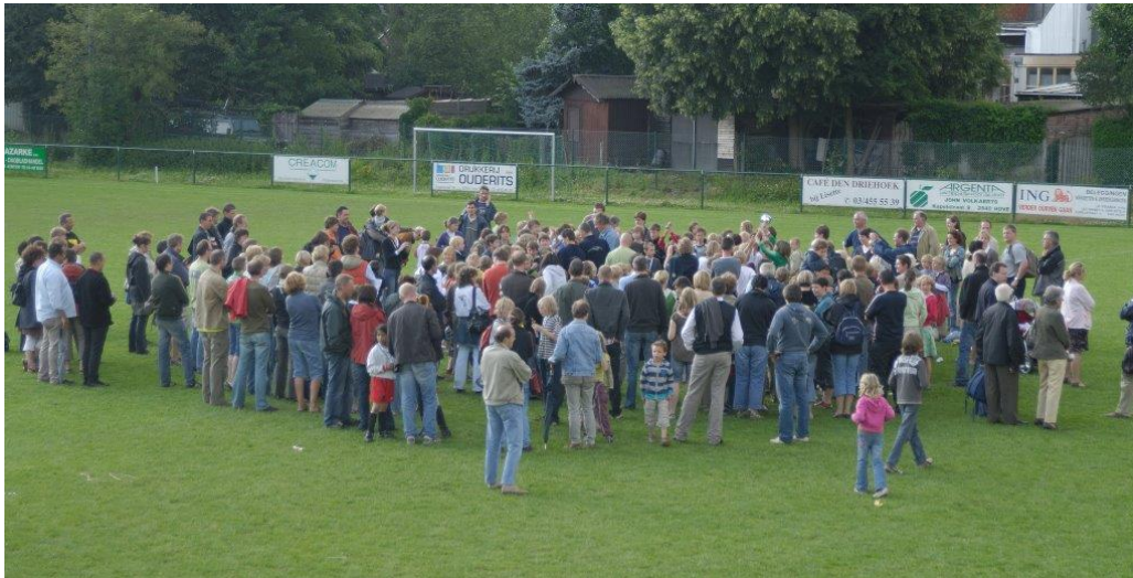
Koninklijke Hove Sport... één grote familie...